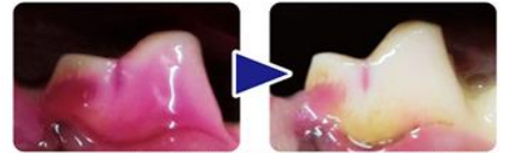
イメージ：当社歯垢除去ガムの試験結果（歯垢を赤く染色して実験）