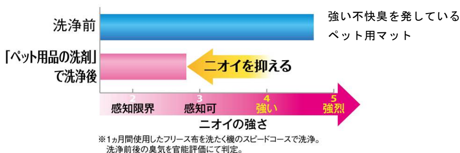
図1 『ペット用品の洗剤』ニオイ除去効果

この『ペット用品の洗剤』のニオイ除去効果を調べた結果、洗浄前には強い不快臭を発生していたペット用マットが、洗浄後にはよく嗅がないと不快臭に気がつかないレベルにまでニオイが抑えられることが確認できました（図1）。